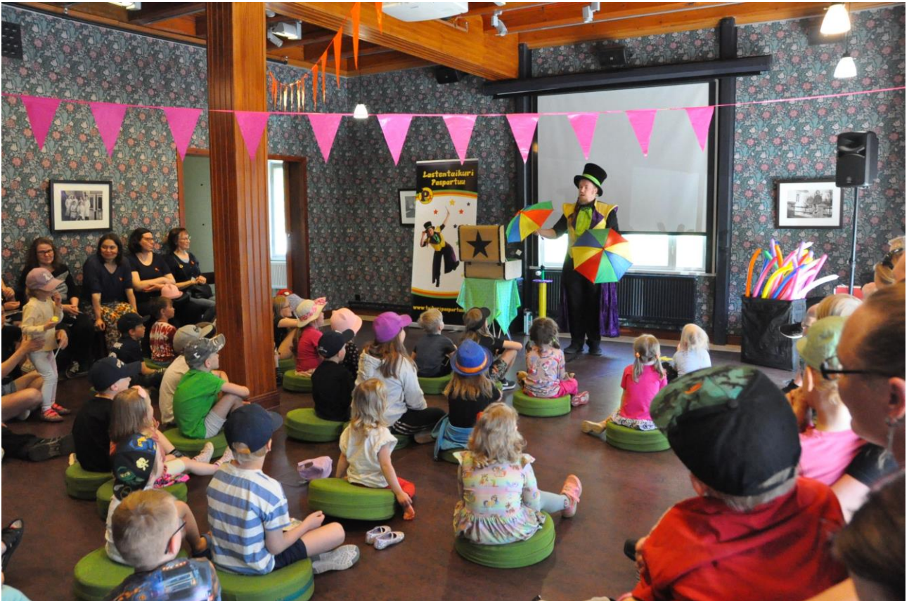
Mediakuva 2: Lapsiperheiden Kevätkarnevaali on yksi Kirjakorttelin museoiden suosituimmista tapahtumista.