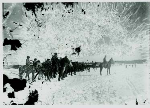
Punakaartia Vammalassa 1918.

Kaikki opetusmateriaalin kuvat ovat Sastamalan seudun museon kokoelmasta. Sanomalehdet ovat Sanomalehtiarkistosta.