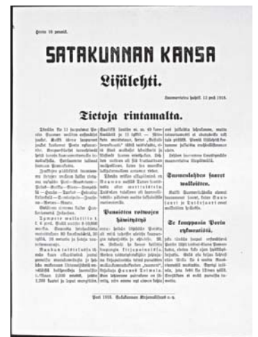
Satakunnan Kansan lisälehti 13.4.1918.