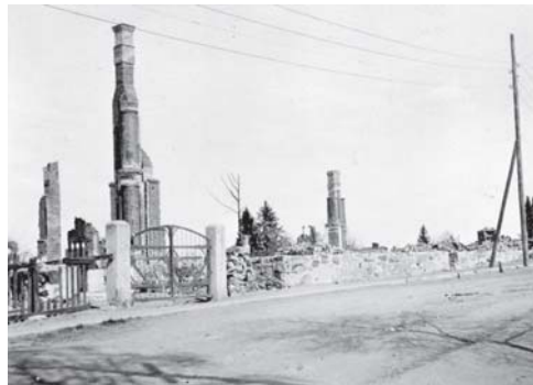
Bäckmanin talon rauniot kirkon suunnalta kuvattuna.