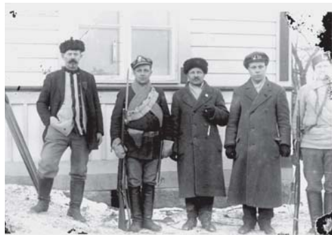
Punakaartia seuratalolla 1918.