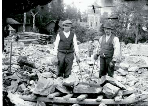
Vammalan palo 1918. Bäckmanin talon rauniot (palossa säilynyt Tornihuvila näkyy taustalla).